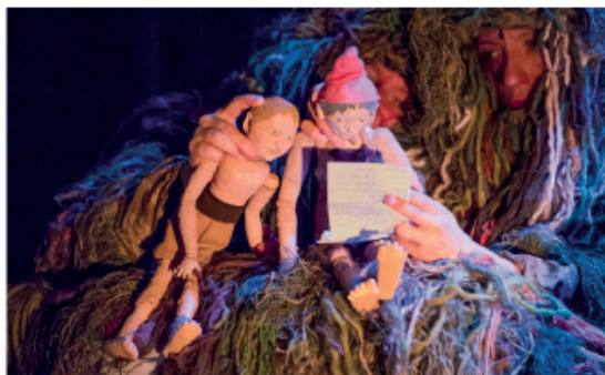
► Enchevêtrement textile pour L'Île aux vers de terre de Cécile Fraysse.